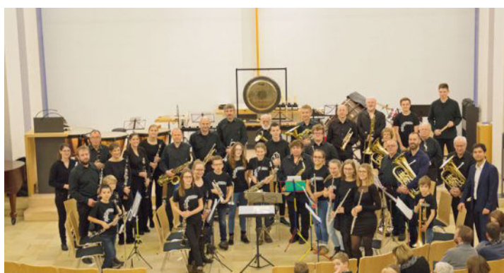
L'ensemble à vent Tramusica proposera 10 morceaux samedi. LDD

Puis les spectateurs auront le plaisir d'écouter plusieurs œuvres bien connues: thèmes de musique de film variété anglaise et deux marches. Dans